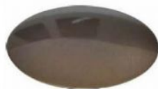
Bd - brass dark burnished lacquered Bd - Messing dunkel brüniert lackiert