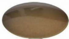
Br - brass burnished lacquered Br - Messing brüniert lackiert