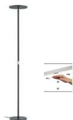
AURA 41.973.xx Fluter / Uplight 1 x 43 W LED, 2.700 K Warmton 5.100 lm