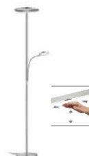
AURA-L 41.974.xx Fluter mit Lesearm / Uplight with reading lamp 1 x 43 W LED, 2.700 K Warmton 5.100 lm Leserm: 1x 10,8 W LED, 2.700 K, 1.100 lm